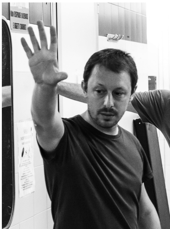
ALESSIO FAVA director

Nel 2005 firma la regia del filmato "Il Piemonte che non ti aspetti", sull'eccellenza artigianale del Piemonte, proiettato durante le Olimpiadi di Torino 2006.